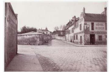
Ansicht des Pariser Viertels in dem die Gründung stattgefunden hat, ca. 1866

Donnerstag, 17. Oktober: Gründungstag der Kongregation der Dienerinnen des hl. Herzens Jesu (1866) Gedenktag des hl. Ignatius von Antiochien 17. 30 Rosenkranz; 18. 00 Hl. Messe